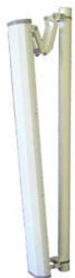
Антенна RFE 2400/90/16

Секторная антенна RFE 2400/90/16 предназначена для построения сетей передачи данных стандарта IEEE 802.11b/g. Используется в составе базового оборудования.